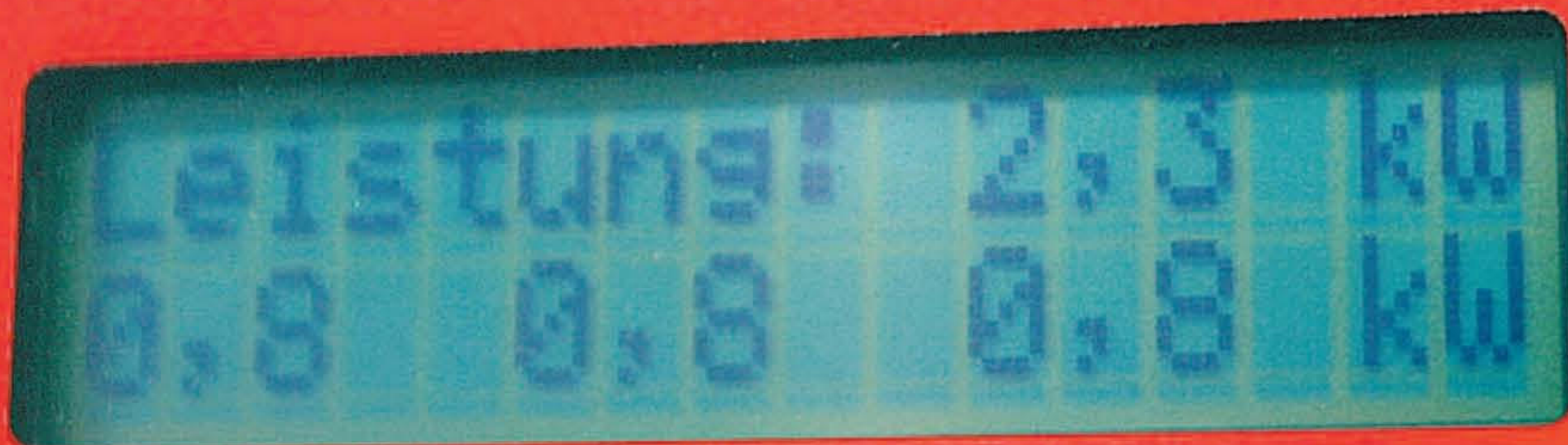
Solar Inverter NT 10000